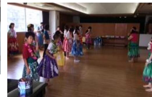
▲夏期プログラム フラダンス