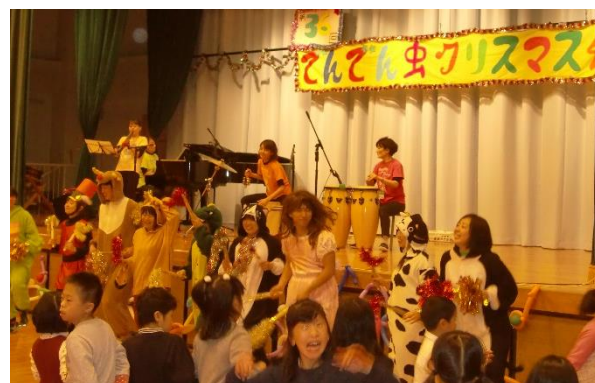
▲ にぎやかな踊りと衣装で大盛り上がり！